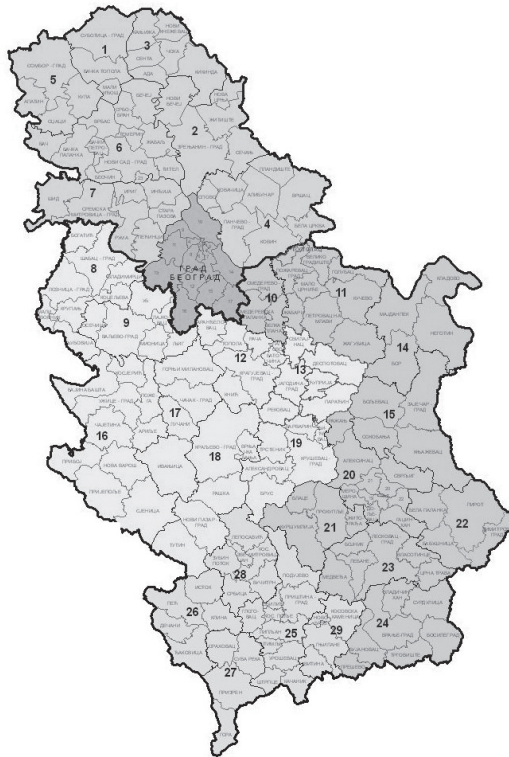
1. ábra: Szerbia statisztikai tervezési régiói Statistical planning regions in Serbia

Jelmagyarázat: 1-7: Vajdaság; 8-19: Sumádia és Nyugat-Szerbia; 10-24: Dél- és Kelet-Szerbia; 25-29: Koszovó; számozás nélkül: Belgrád.