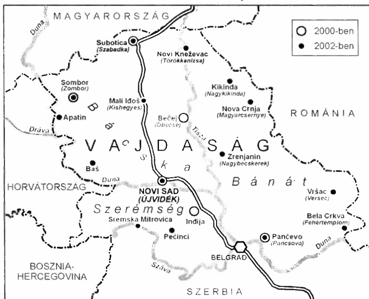
A vajdasági felmérésbe bevont települések (Settlements involved into the survey in Voivodina)